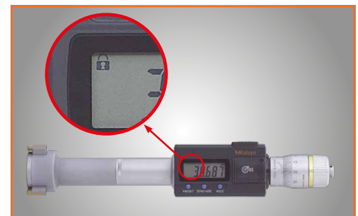
Funktionssperre (am Schlosssymbol zu erkennen)