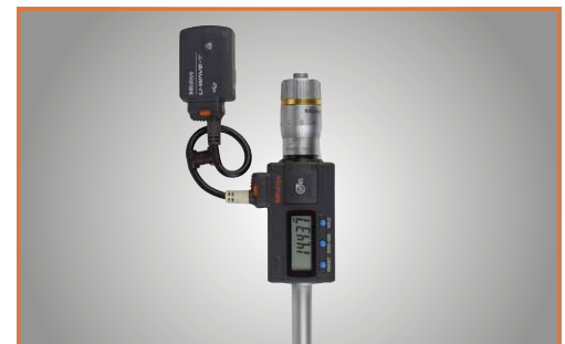
Beispiel mit U-WAVE-T-Sender und Verbindungsleitung