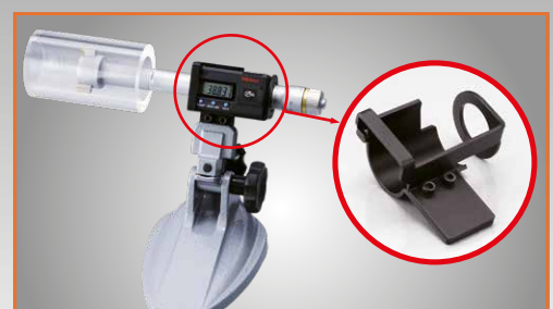
HALTERUNG FÜR MESSSCHRAUBENSTÄNDER 04AZB157 inkl. Bügelmessschraubenständer 156-101-10