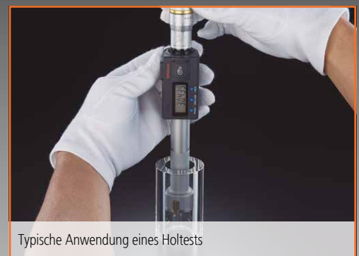
Typische Anwendung eines Holtests